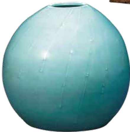
内山 政義 [ 青白磁滴文壺 ] 2015年 Masayoshi UCHIYAMA [ Jar with pale blue glaze and water drop design ] 2015