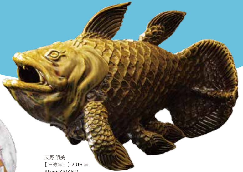
天野 明美 [ 三億年! ] 2015年 Akemi AMANO [ LONG LONG TIME AGO ] 2015