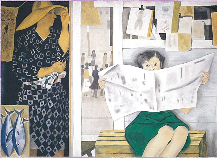
新聞 1950年 京都国立近代美術館蔵