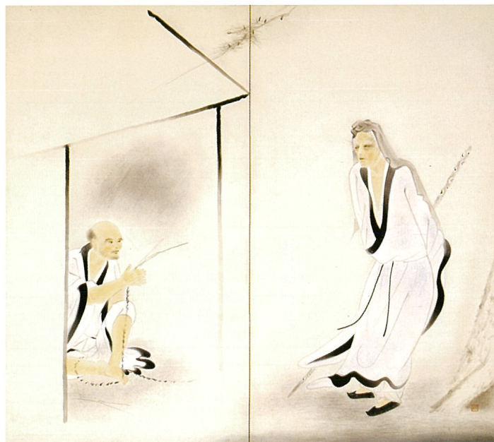
〈 惠藏牧牛 1931 〉