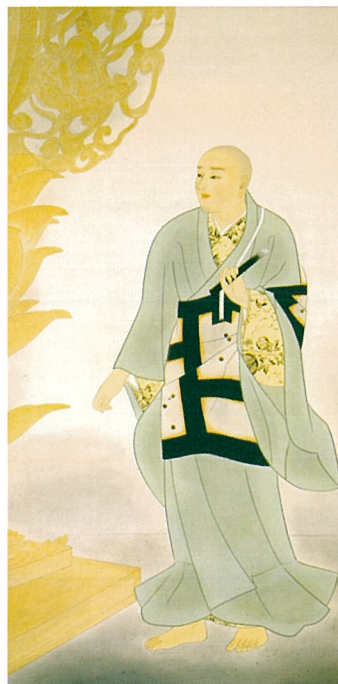
〈 定朝 1933 〉

〒603-8355 京都市北区平野上柳町26-3 TEL 075-463-0007 http://www2.ocn.ne.jp/~domoto/