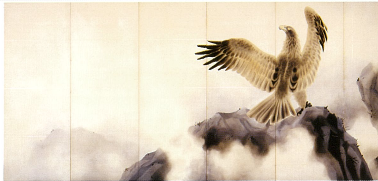
〈 爽籟高清 1940 〉