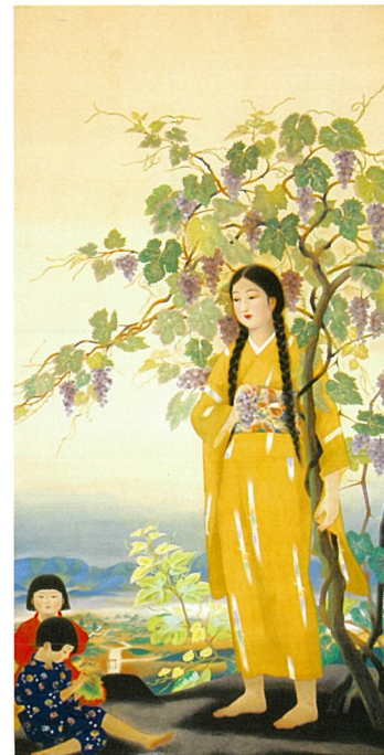
〈 實 1930 〉