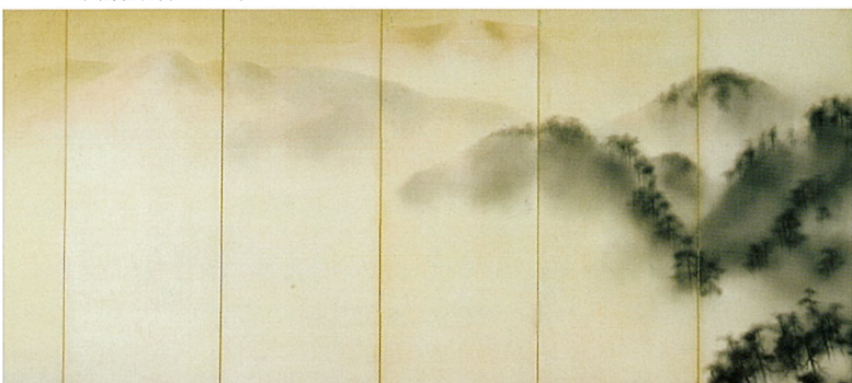
〈 雲収日昇 1938 〉