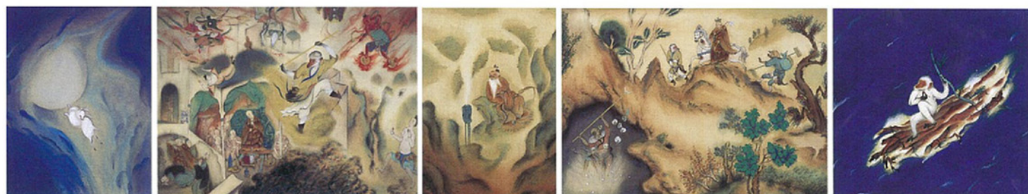
第2回帝展出品作、92年ぶりに公開