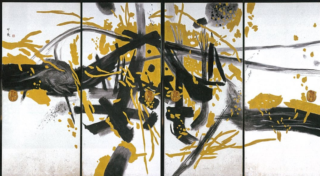
上右：《風神》(全4面) 1963年 高知・竹林寺蔵(前期展示) 上左：《雷神》(全4面) 1963年 高知・竹林寺蔵(後期展示) 下：《太平洋》(全8面) 1963年 高知・竹林寺蔵(後期展示)

KYOTO PREFECTURAL INSHO-DOMOTO MUSEUM OF FINE ARTS 〒603-8355 京都市北区平野上柳町26-3 TEL.075-463-0007 http://insho-domoto.com