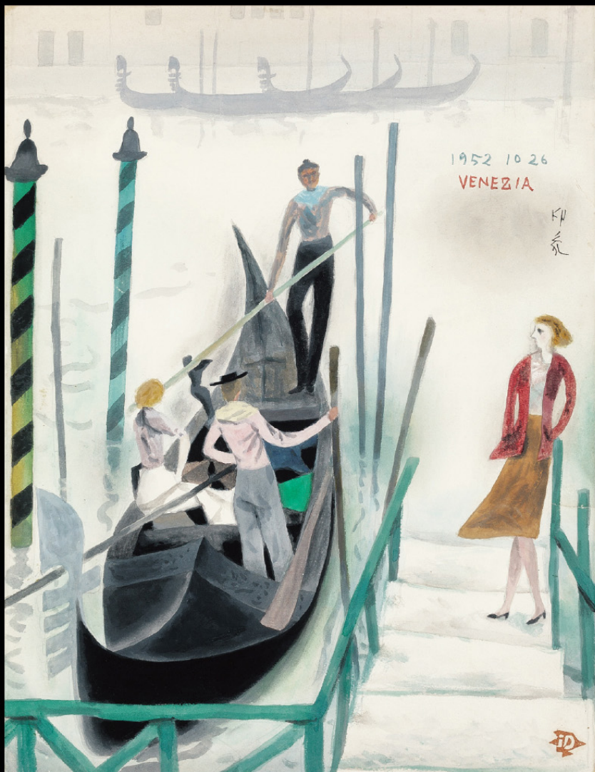
堂本印象《ベニスのグランカナル》1952年 京都府立堂本印象美術館蔵