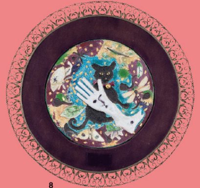
5 《ローマの朝》1952年 6 《アルゼリヤの女》1954年 7 《少女》1956年 8 《白い手袋と猫》1954年 9 《シテ附近》1952年 10 《ボア・ド・ブローニュのカフェ》1952年 11 《ビガール(モンマルトル)》1952年 12 《コンコルド広場》1952年 9~12「美の聲音」(挿絵)、1~12いずれも京都府立堂本印象美術館蔵