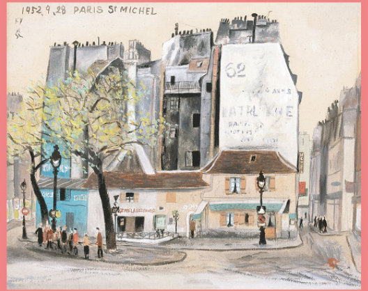
1 《ドイツの朝》1952年 2 《窓》1953年 3 《メトロ》1953年 4 《サン・ミッシェル》1952年