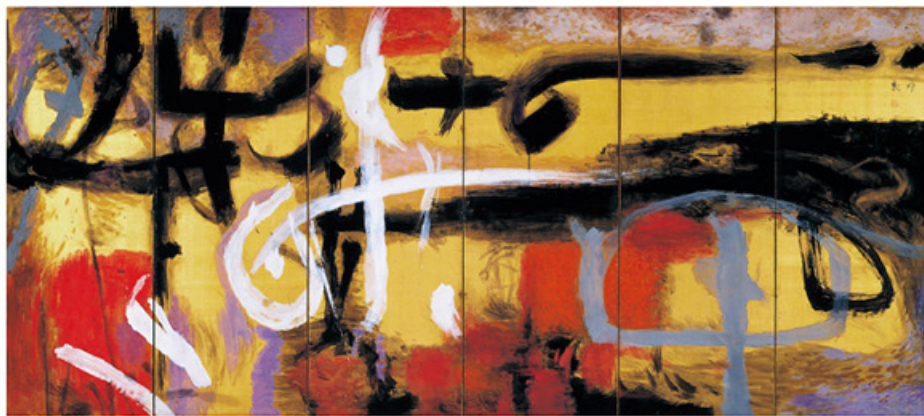
堂本印象 風神 1961年 京都府立堂本印象美術館