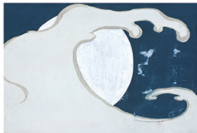
神坂雪佳 立波(「百々世草」原画) 1909-10年 芸艸堂