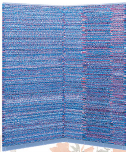
福本繁樹 風神雷神(風神) 2001年