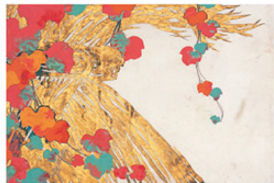
神坂雪佳 蕨(「百々世草」原画) 1909-10年 芸艸堂