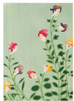
神坂雪佳 美人草(「滑稽図案」)1903年 芸艸堂

2015年の琳派400年記念にあたり、当館では堂本印象を中心に近現代の京都画壇における琳派の要素に注目し、改めてその魅力を紹介いたします。 桃山から江戸初期の京都で、本阿弥光悦、俵屋宗達そして尾形光琳によって大成された琳派は、鋭い自然感覚に基づきながらも形態を大胆に簡略化した大らかなで優美な装飾美術として、絵画をはじめ染織、陶芸、漆芸などにおいて人々の生活空間に息づいてきました。明治以降も京都では多くの画家や工芸家が琳派を強く意識した作品を生み出しており、琳派は近現代の美術にも大きな影響を与えているといえるでしょう。 なかでも、神坂雪佳は絵画のほかにも図案集『百々世草』など琳派の装飾性に注目した作品を数多く手がけ、図案(デザイン)の世界を確立しました。また、印象も図案から本画へ転進し、晩年には単純な構成による琳派的な絵画を制作した作家のうちの一人です。雪佳や印象をはじめとして、近現代の京都画壇では琳派に関するモチーフや表現などをとり入れた作家による作品がしばしば見られます。 本展では、雪佳や印象を中心とする近代から現代の京都画壇において、洗練された雅な琳派の造形感覚を「ユーモア」と「ウィット」という側面から見つめ直したいと思っております。それによって、京都画壇に流れる琳派意識を再認識していただければ幸いです。