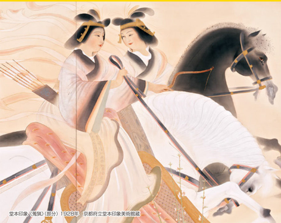
堂本印象《菟狹》(部分) 1928年 京都府立堂本印象美術館蔵