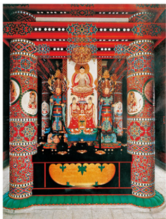
在りし日の四天王寺宝塔堂内 1941年