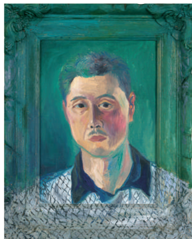
印象自画像 昭和10年(1935)