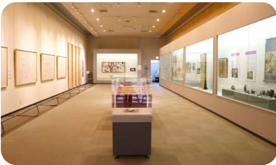
活動場所の展示室