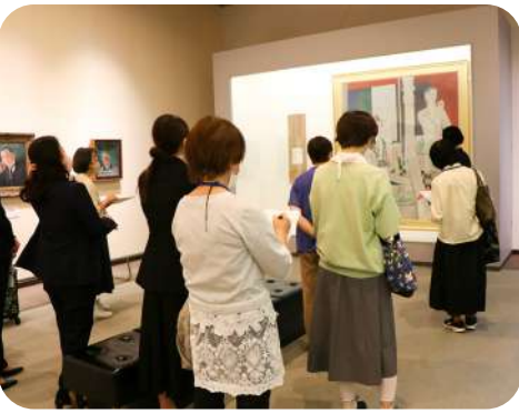
ボランティア向け展示解説