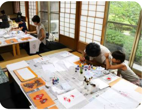
親子向けワークショップのサポート