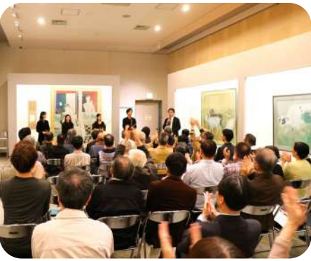
コンサート会場の設営やお客様のご案内