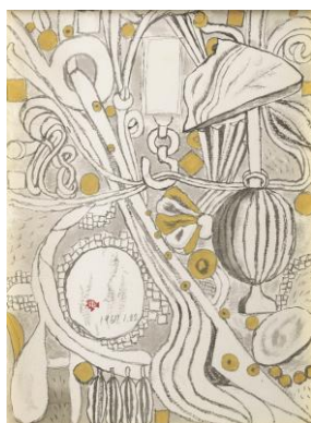
堂本印象 《瞑想(堂本美術館壁面装飾)》 昭和42年(1967)