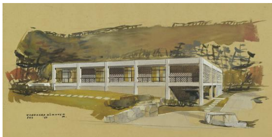
「堂本美術館完成予想図」戦後