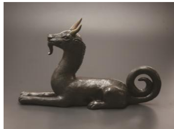
ひきゆう 今井真正 《貔貅》