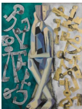
堂本印象《金の鍵と銀の鍵》 昭和30年(1955)