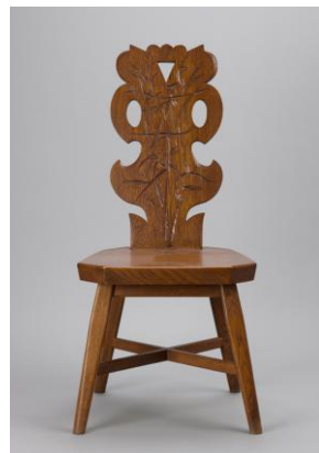
《椅子》(デザイン:堂本印象) 昭和41年(1966)