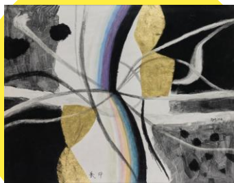
堂本印象《感喜》 昭和41年(1966)